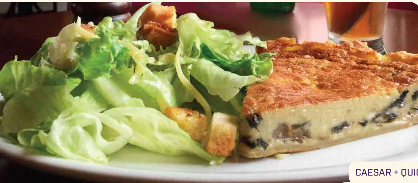
CAESAR + QUICHE

Massa crocante e folhada, recheada com nosso maravilhoso frango pomodoro e gota de catupiry no topo - R$ 6,00