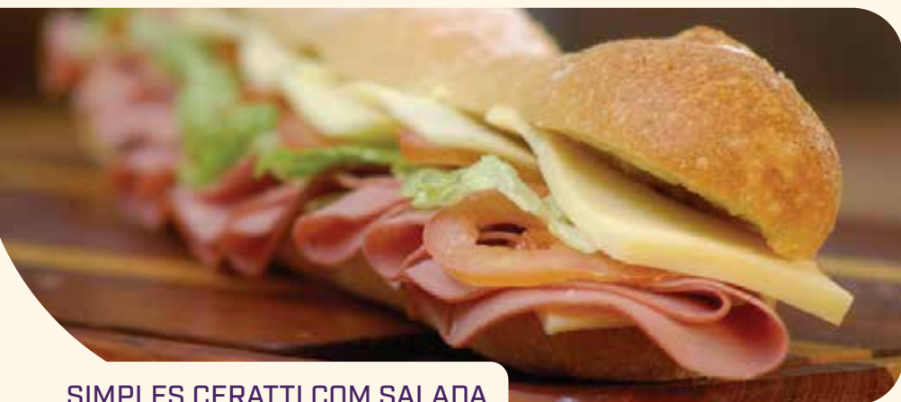
SIMPLES CERATTI COM SALADA